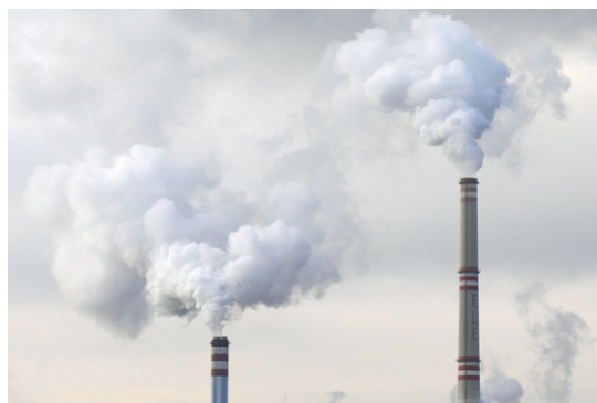
圖1 兩家工廠的碳排放量不同，便促成碳排放權的交易

進入遊樂場需要門票，租用房屋需要付租金，我們經常在市場中付費、交易以獲取某種權利，而碳市場中交易的，正正就是「碳排放權」，即排放二氧化碳等溫室氣體的權利。